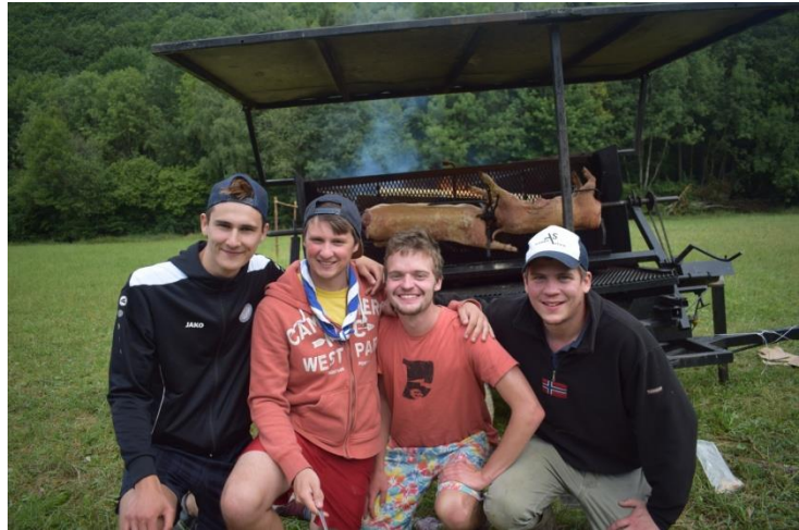
Husky, pour le staff Albert Schweitzer.

Merci à tous les acteurs de ce camp inoubliable, il restera un bon nombre d'années gravé dans nos mémoires !