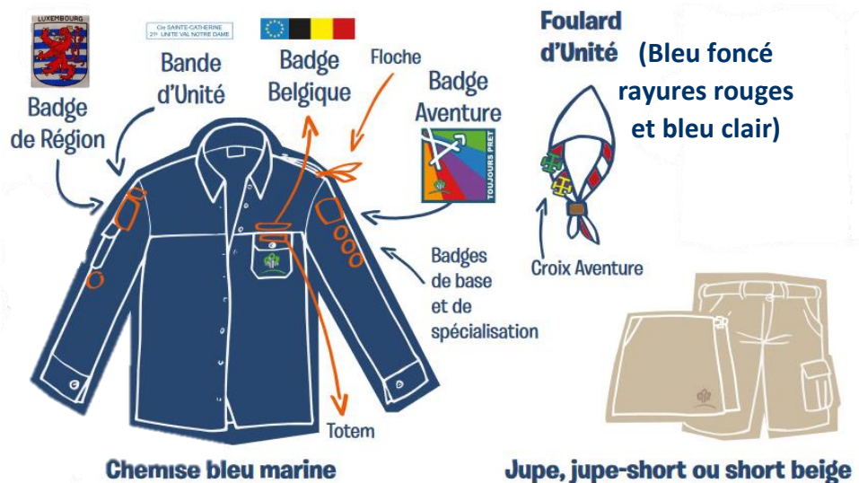
Chemise bleu marine

(N'oubliez d'adapter votre tenue en fonction du temps et laissez à la maison vos appareils électroniques, maquillages et vos objets de valeurs.)